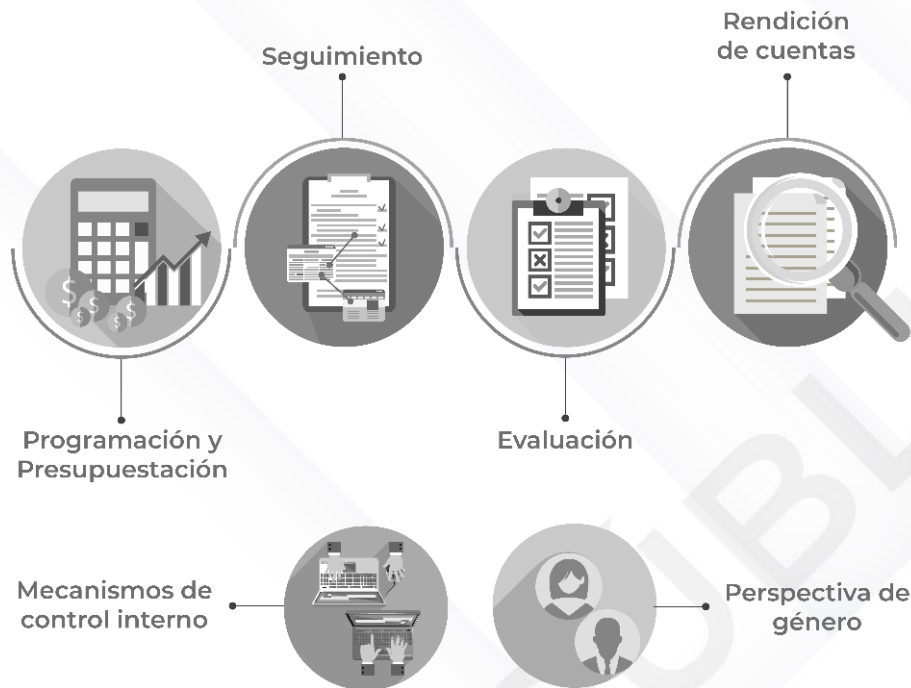
Ilustración 2. Procedimientos generales de la auditoría de desempeño 2022

Fuente: Elaboración propia con base en los procedimientos generales de auditoría de desempeño para la Cuenta Pública 2022 del orden municipal.