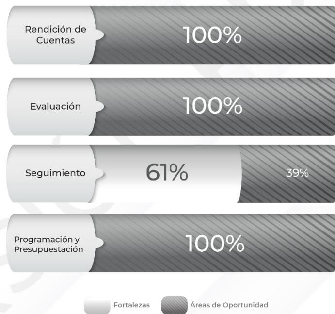
Gráfico 1. Resultados de los procedimientos generales relacionados al ciclo presupuestario