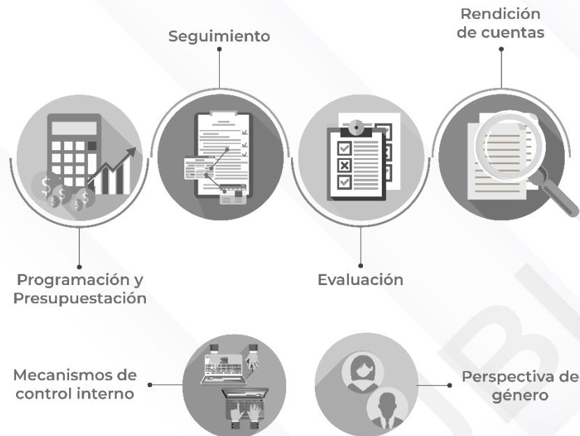
Ilustración 2. Procedimientos generales de la auditoría de desempeño 2022