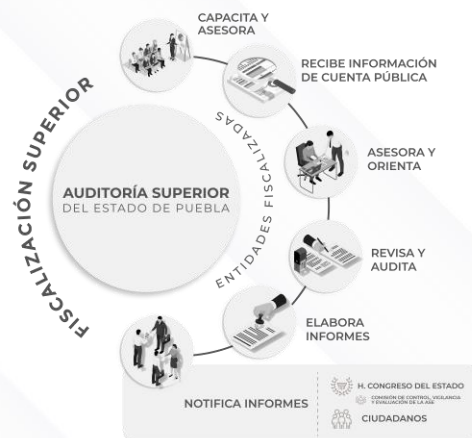
Ilustración 1. Proceso de Fiscalización Superior