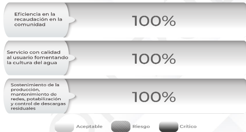
Gráfico 2. Comportamiento de los indicadores del Pp.