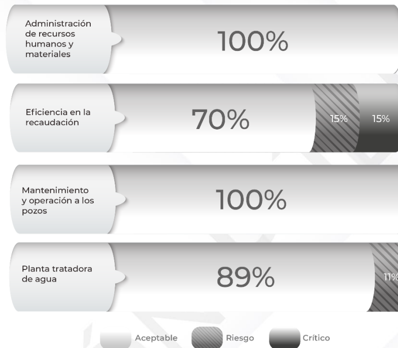
Gráfico 2. Comportamiento de los indicadores de los Pp