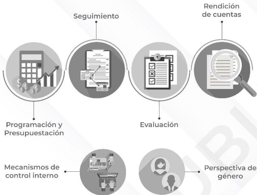
Ilustración 2. Procedimientos generales de la auditoría de desempeño 2022