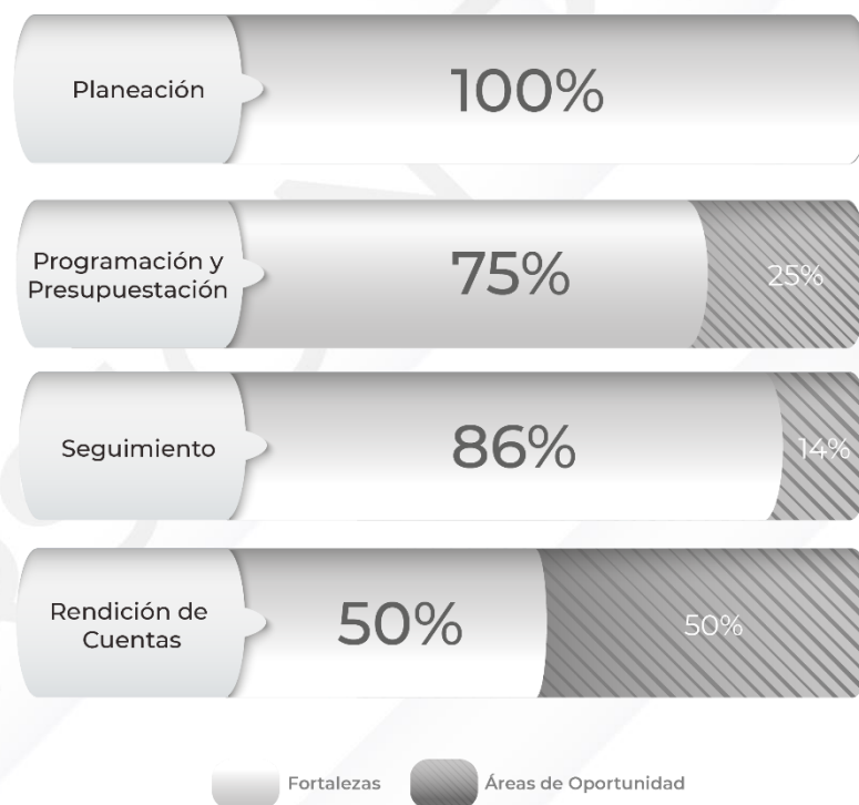
Gráfico 1. Resultados de los procedimientos relacionados al Ciclo Presupuestario