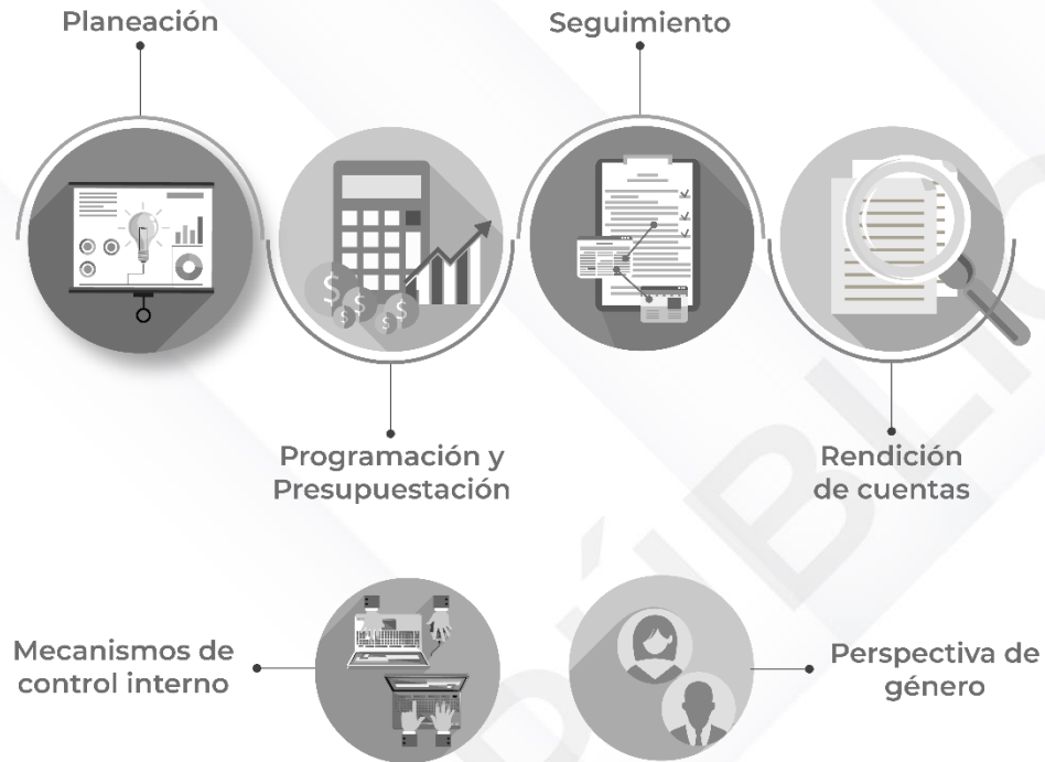
Ilustración 2. Procedimientos generales de la auditoría de desempeño 2022