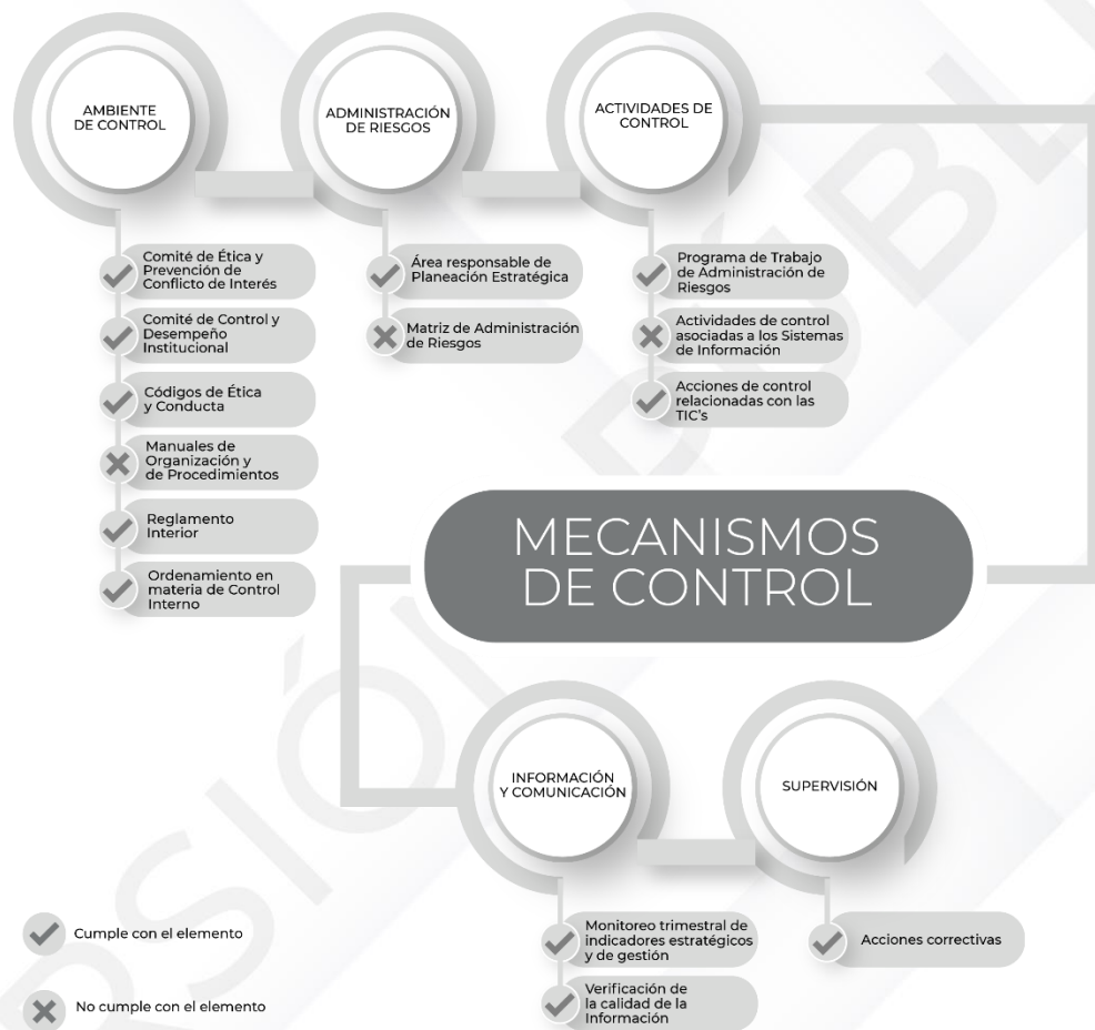
Ilustración 3. Resultados de los procedimientos específicos de los Mecanismos de Control Interno