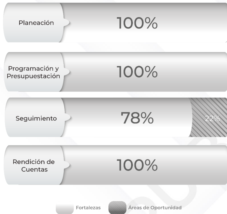
Gráfico 1. Resultados de los procedimientos relacionados al Ciclo Presupuestario