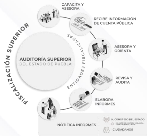
Ilustración 1. Proceso de Fiscalización Superior