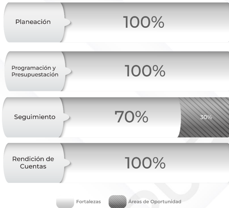
Gráfico 1. Resultados de los procedimientos relacionados al Ciclo Presupuestario