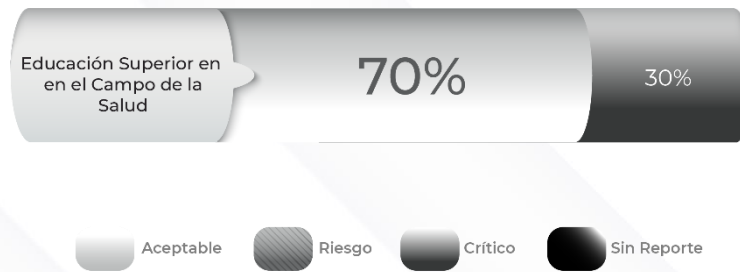
Gráfico 2. Cumplimiento de los indicadores de los Pp