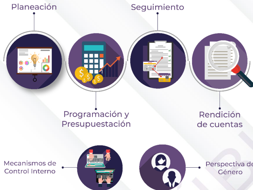
Ilustración 2. Procedimientos generales de la auditoría de desempeño 2022