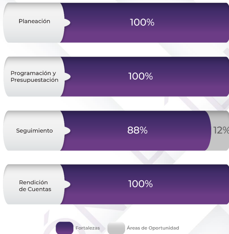
Gráfico 1. Resultados de los procedimientos generales relacionados al Ciclo Presupuestario