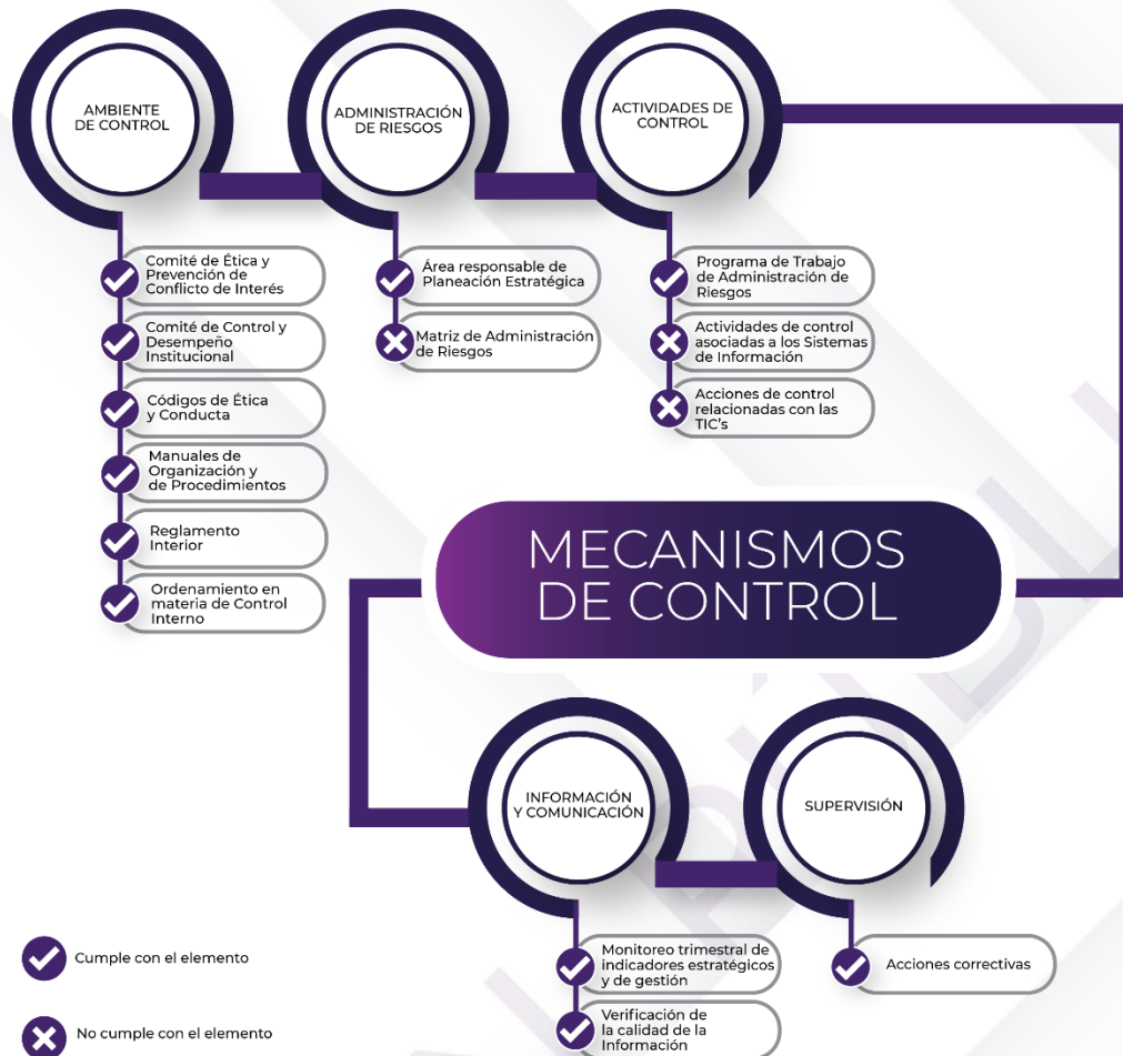
Ilustración 3. Resultados de los procedimientos específicos de los Mecanismos de Control Interno