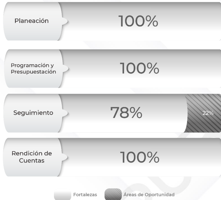
Gráfico 1. Resultados de los procedimientos relacionados al Ciclo Presupuestario