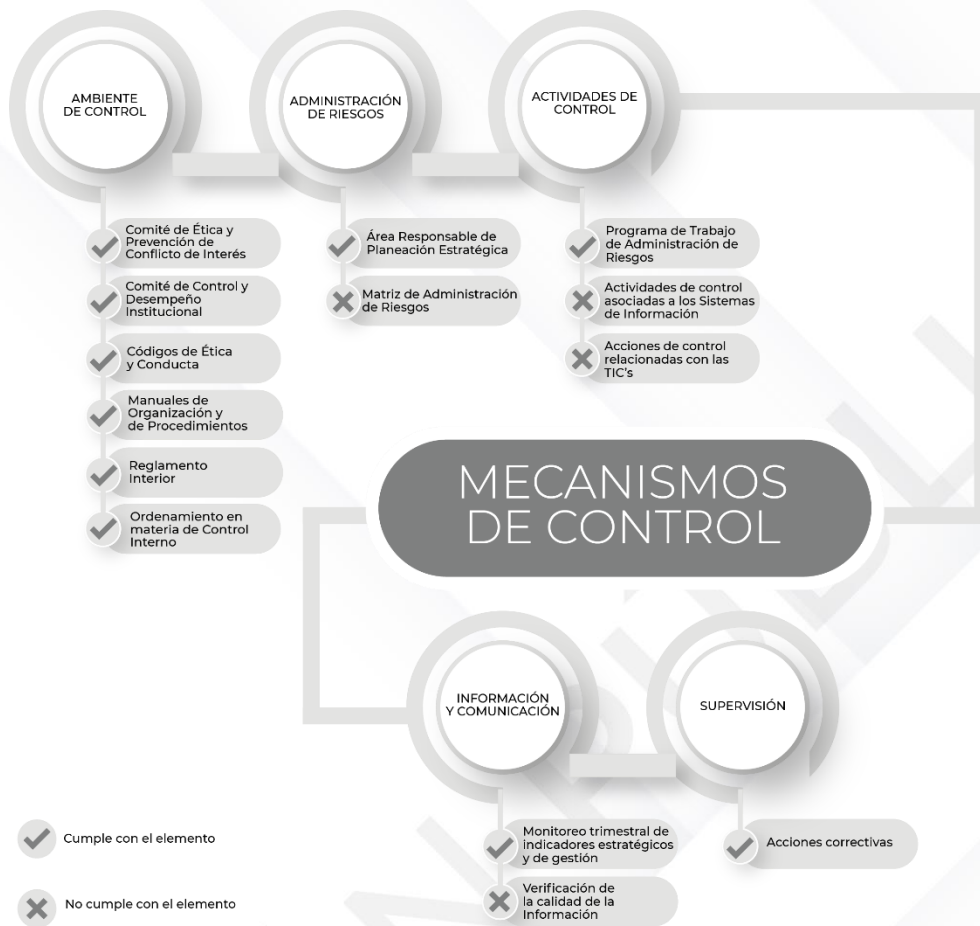
Ilustración 3. Resultados de los procedimientos específicos de los Mecanismos de Control Interno