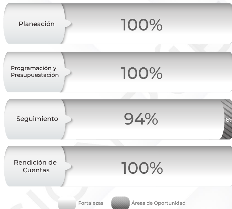
Gráfico 1. Resultados de los procedimientos relacionados al Ciclo Presupuestario