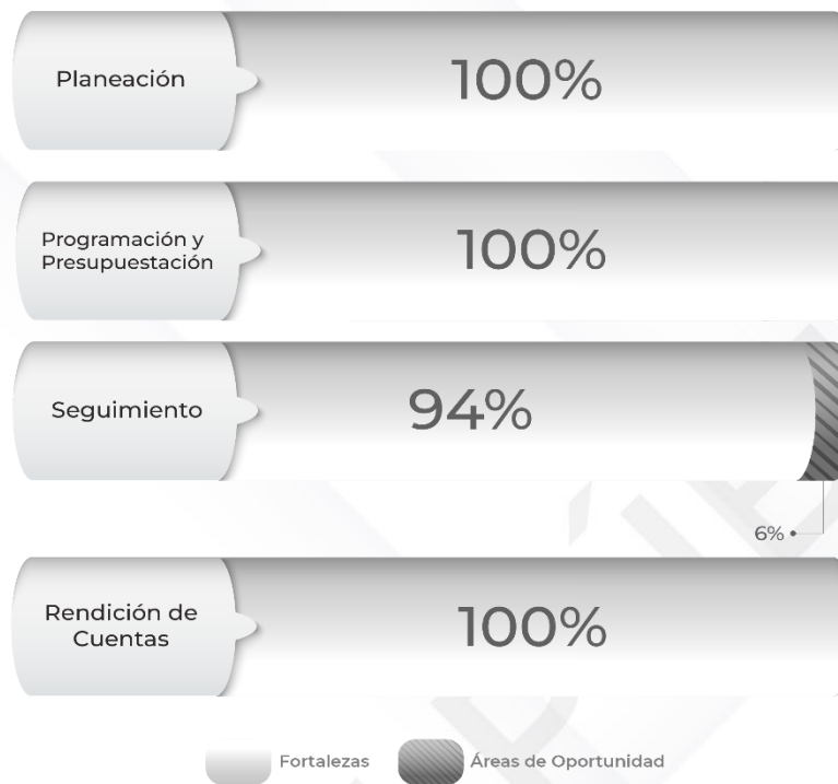
Gráfico 1. Resultados de los procedimientos relacionados al Ciclo Presupuestario