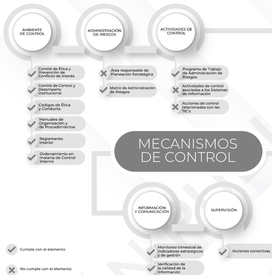
Ilustración 3. Resultados de los procedimientos específicos de los Mecanismos de Control Interno