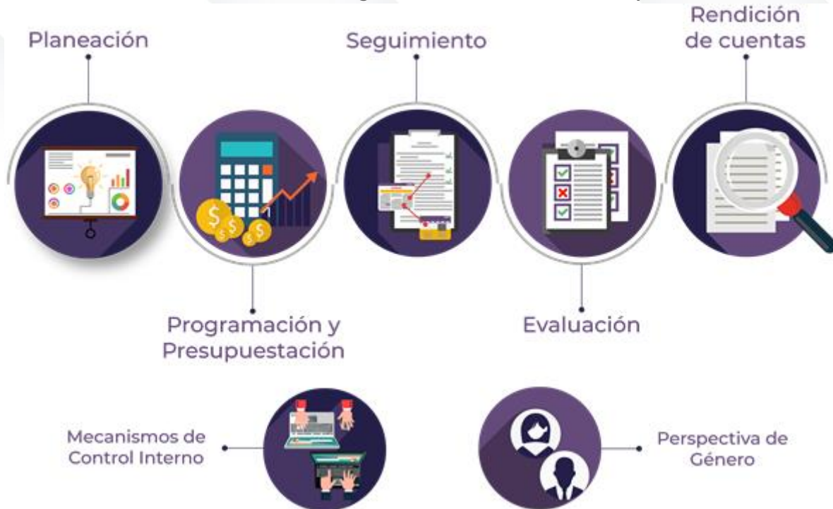
Ilustración 2. Procedimientos generales de la auditoría de desempeño 2022