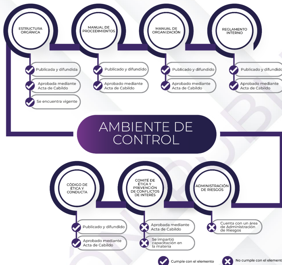
Ilustración 3. Resultados de los procedimientos de los Mecanismos de Control Interno