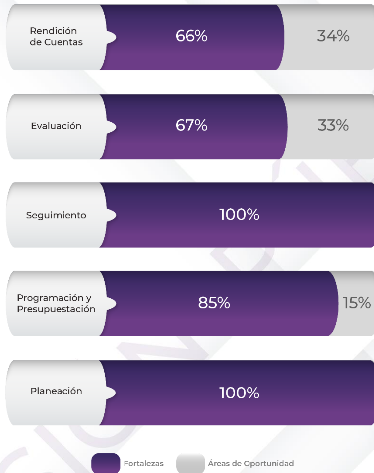
Gráfico 1. Resultados de los procedimientos generales relacionados al ciclo presupuestario