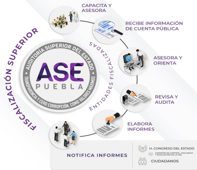
Ilustración 1. Proceso de Fiscalización Superior