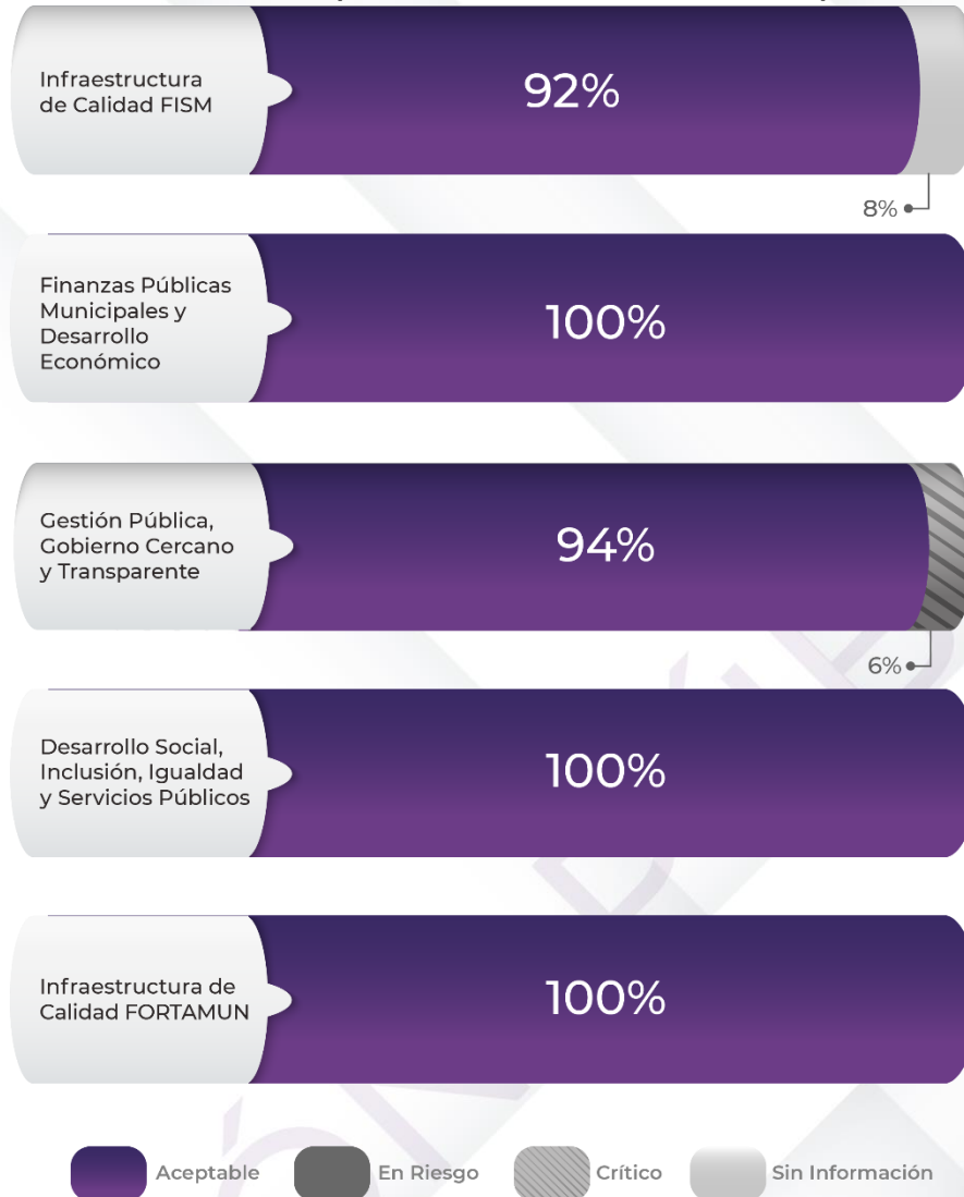
Gráfico 2. Comportamiento de los indicadores de los Pp