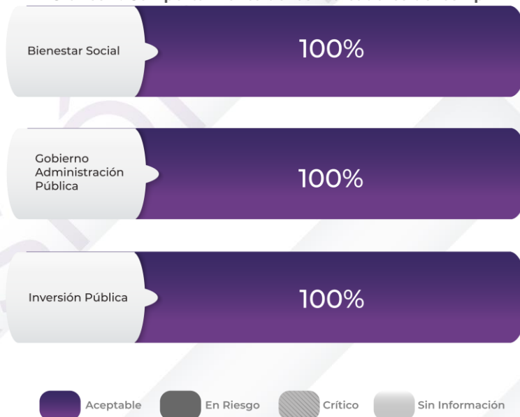
Gráfico 2. Comportamiento de los indicadores de los Pp