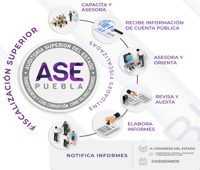
Ilustración 1. Proceso de Fiscalización Superior