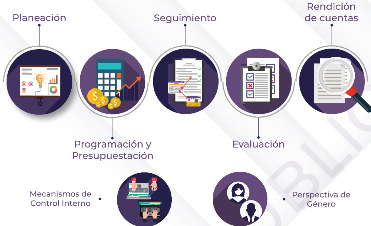
Ilustración 2. Procedimientos generales de la auditoría de desempeño 2022