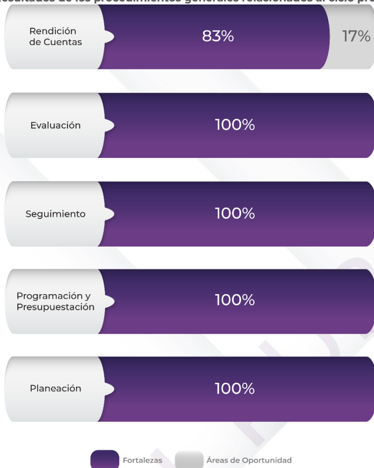
Gráfico 1. Resultados de los procedimientos generales relacionados al ciclo presupuestario