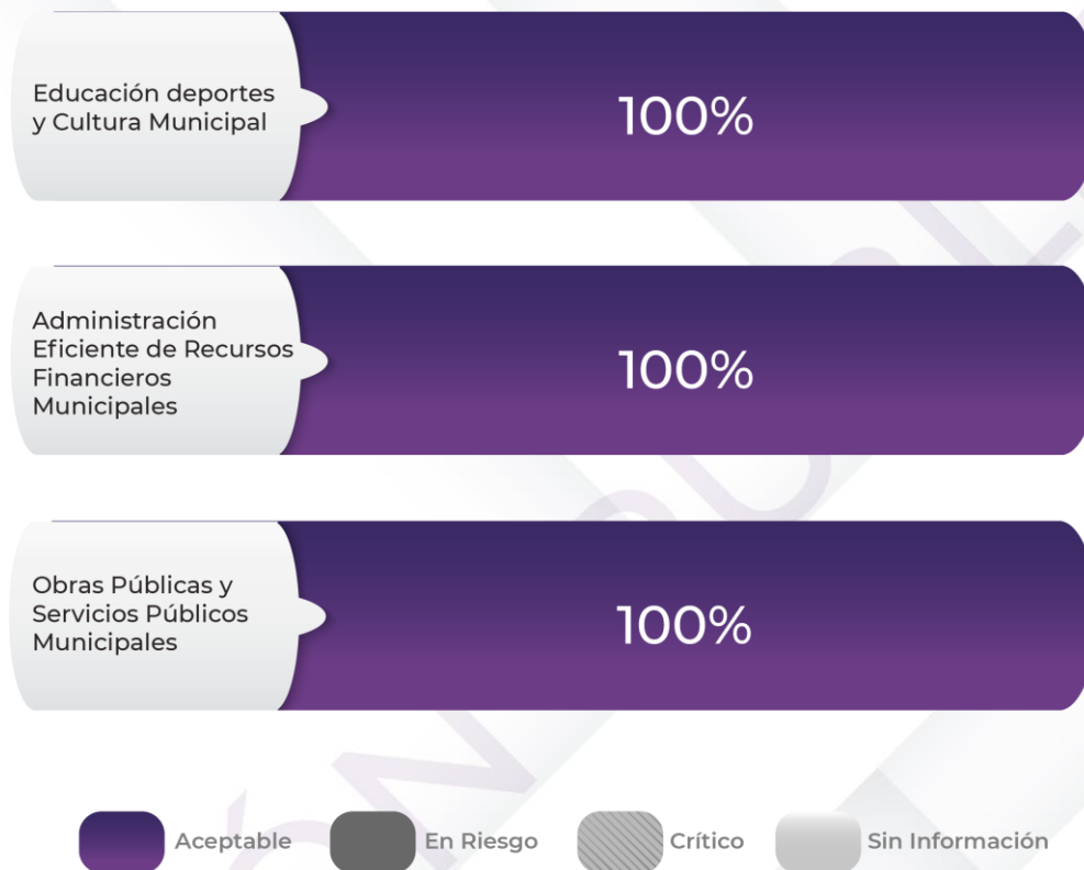
Gráfico 2. Comportamiento de los indicadores de los Pp

Fuente: Elaboración propia con base en los resultados del proceso analítico de revisión y valoración de la documentación remitida por la Entidad Fiscalizada en atención al requerimiento de información inicial, Cuenta Pública 2022