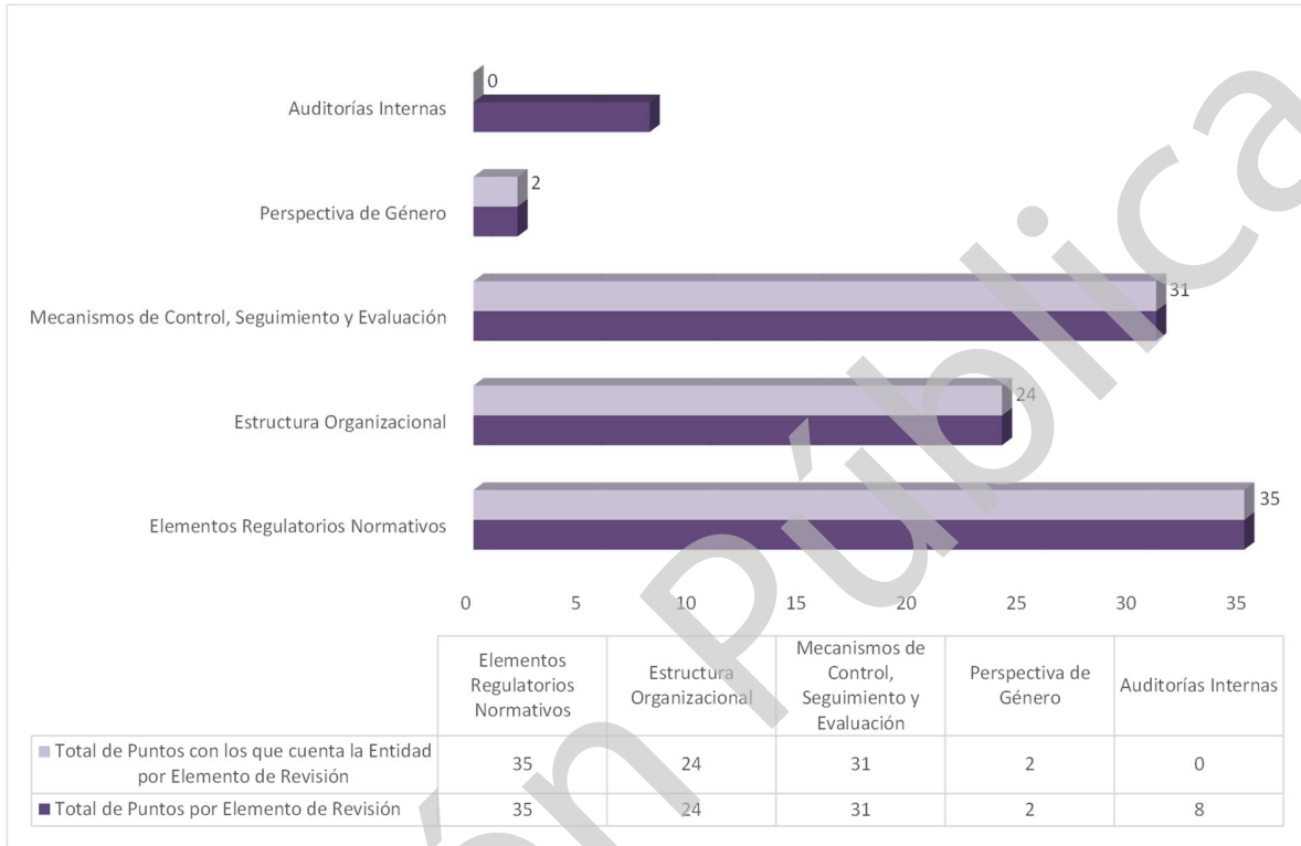
Grafica 1 Cumplimiento de los Mecanismos de Control Interno Ejercicio 2020