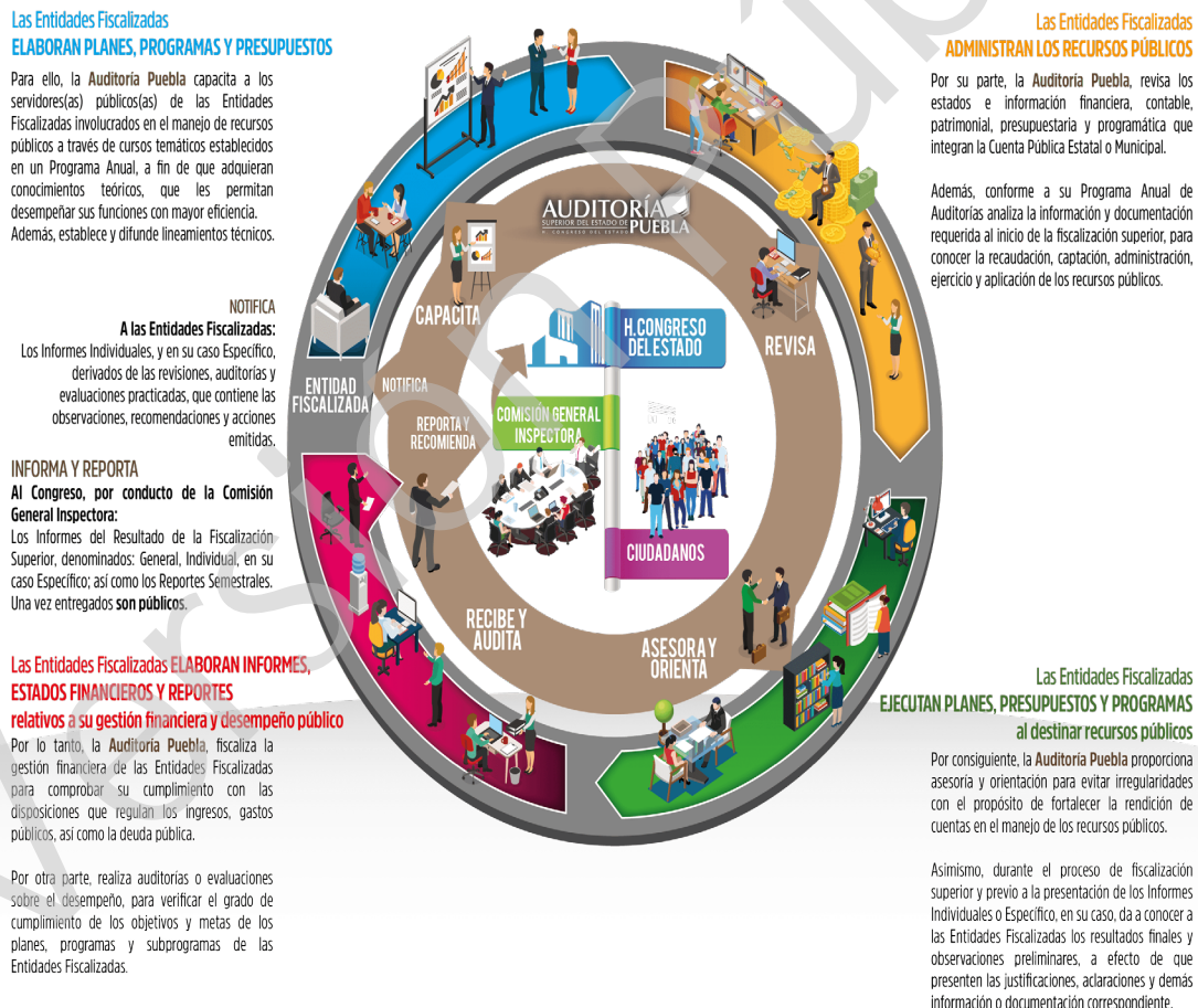
Diagrama 1 Proceso de Fiscalización Superior 2017