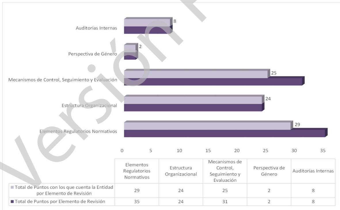
Gráfica 1 Cumplimiento de los Mecanismos de Control Interno Ejercicio 2020